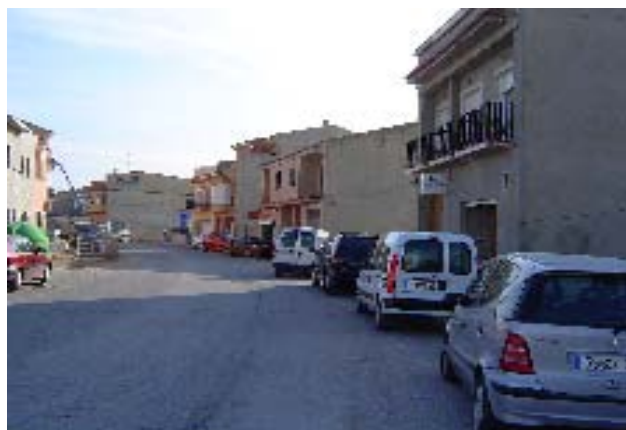
Ronda Racó de Cifre.

Tercer. Aprovar definitivament el compte detallat de les quotes d'urbanització desglossat per interessats en funció dels m 2 de façana dels immobles afectats, d'acord amb la relació elaborada per l'oficina tècnica municipal.