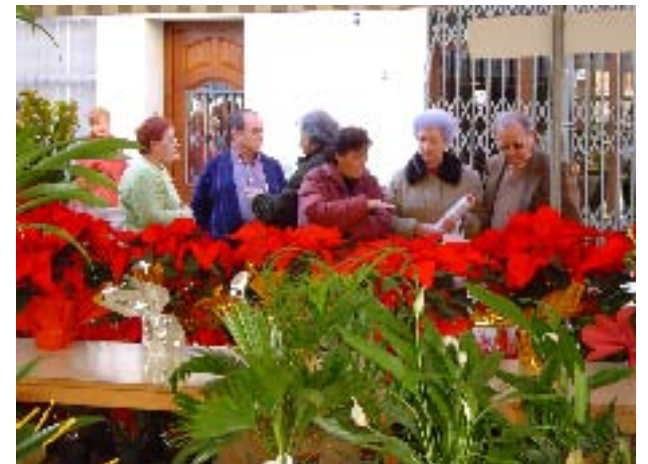
Exposició "Naturalesa a la CV".

Segon. Adjudicar la realització del taller d'art floral el diumenge 12 de desembre, a Flores Senyera, per import total de 1.200,00 € després d'haver estudiat els tres pressupostos presentats, atès que és el més econòmic dels tres.