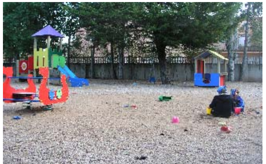
Imatges dels nous equipaments a les instal·lacions de la guarderia municipal del nostre poble.