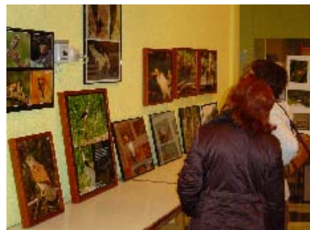
Exposició "Naturalesa a la CV".

1.4.- Concessió de subvenció a la SM Lira Castellonera.