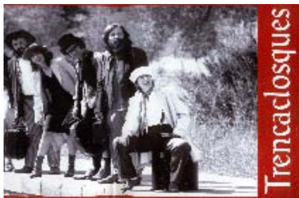
Membres del grup Rodamons Teatre.