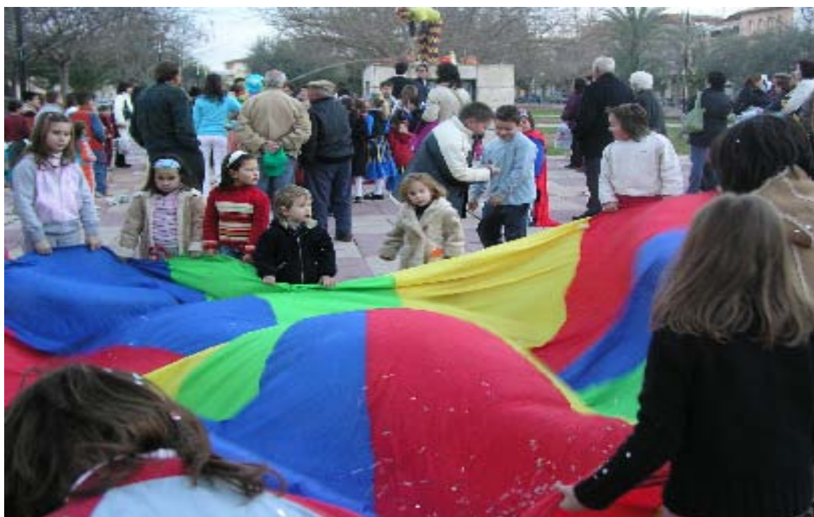
Els més menuts acudiren disfressats al Parc de l'Estació on gaudiren d'una trencada de perols, carreres de sacs, balls i cançons.