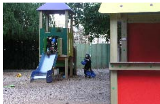
Alguns dels jocs infantils adquirits.

- A la mercantil Manufacturas Deportivas Javier González Ruiz, SL, un "Parque Astillero", una "Casteta - tienda", una figura de molls "Barco Vikingo", una figura de molls "Bus", una figura de molls "Quad", i un "Tren cabezón de la sal", per import total de 14.425,18 €