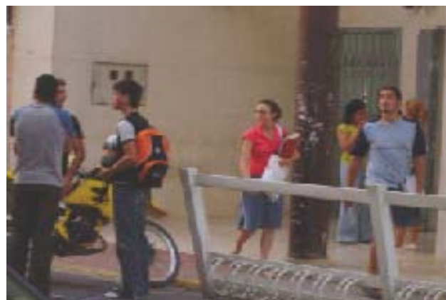
Façana de la Casa de la Cultura. / RAMÓN VICENT.