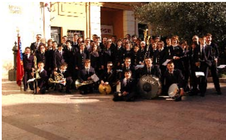
Els músics, els instruments i les partitures són elements fonamentals.

Com fer música sense músics, ni instruments, ni partitures, o deconstrucció de la música, deia jo. I li afegia: llencem a perdre el llenguatge, la natura, la cultura, el món, ...amb paraules que en lloc de dir, fan a viceversa, desconcerten. Amb paraules que diuen una cosa i la contrària. Anava dient-li al meu fill, però sense parar massa atenció al que li deia,