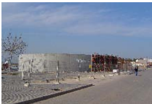
Vista del pavelló de la nova zona esportiva.

Segon. Comprometre's a l'exacte compliment de les Directrius que es mencionen, en el procés d'execució de les obres.