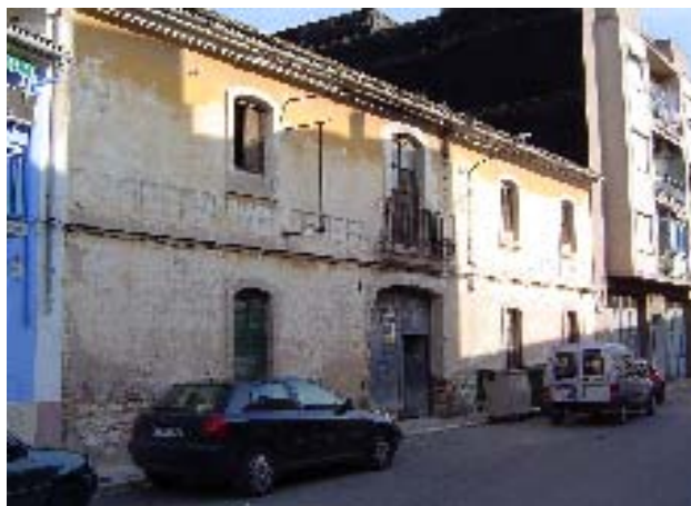
Façana de l'edifici INMAVI. / RAMÓN VICENT.

Segon. Sol·licitar el corresponent informe a la Direcció General de Patrimoni Artístic de la Conselleria de Cultura, Educació i Ciència.