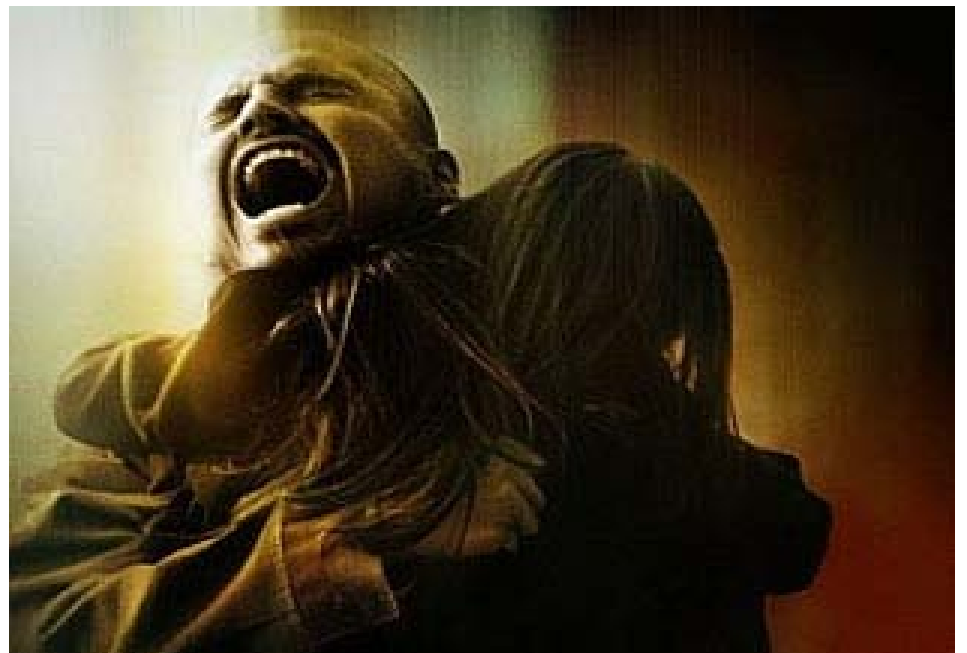
Cartell de la pel·lícula guanyadora de l'Oscar a la millor pel·lícula

Des del punt formal aquesta pel·lícula és hereua d'obres com Grand Canyon (Lawrence Kasdan, 1991), Short Cuts (Robert Altman, 1993), Magnolia (Paul Thomas Anderson, 1999), Amores perros (Alejandro González Iñárritu, 2000), Traffic (Steven Soderbergh, 2000) i, tot i que amb altres pretensions, Pulp Fiction (Quentin Tarantino, 1994). En totes elles, amb un estil narratiu vigorós i