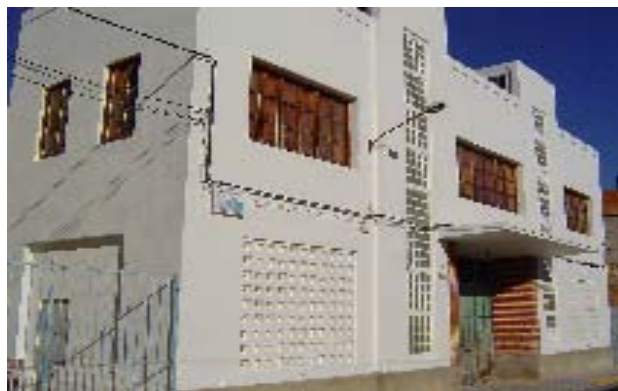
Edifici Antiga Cambra Agrària.

S'adopta per unanimitat l'acord d'adjudicar a la mercantil "Instal·lacions elèctriques Rafael Sanz Torregrosa", la instal·lació a l'edifici conegut com antiga Cambra Agrària d'una hornacina i derivacions individuals, així com el desmuntatge de la instal·lació vella i tramitacions, a més de 4 projectors de 400 W i 12 de 150 W, tot això d'acord amb el pressupost presentat amb número 23/2005 de 16/11/05, i per import total d'11.630,04 €