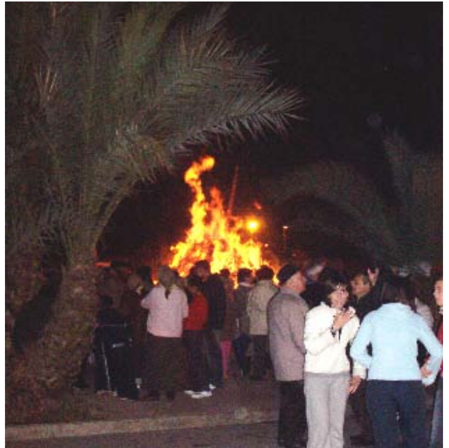
Imatges de la nit de la torrada i crema de la foguera de Sant Antoni. Els festers de Santa Bàrbara prepararen aquest acte amb molta il·lusió/ CEDIDES.