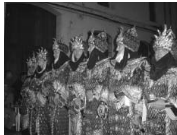
Un any més l'entrada de moros i cristians van ser un dels espectacles més aplaudits. / R.V.

la repercussió fou fortíssima. Acte seguit tot el poble gaudí a la picadeta popular de la germanor i felicitat que a les festes són cada vegada més necessàries. Una vesprada farcida d'actes esportius, el futbol i l'atletisme amb la XXII volta a peu que enguany es canviava de dia al primer dissabte, deixà constància de l'augment de la participació en dit esdeveniment i de la importància que la prova està tenint al calendari d'estiu d'aquest esport.