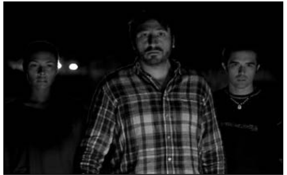
Imatge d'una de les escenes de la pel·lícula "La noche de los girasoles" / ARXIU.

drama, hi ha fins i tot qui la cataloga de comèdia negra. I no és un assumpte anodí el tema de la formulació genèrica, doncs el gènere és, molt sovint, l'estructura sobre la que es construeixen les pel·lícules i sobretot el que orienta la posició dels espectadors conduint llurs expectatives. Per això, qui espera trobar-se un thriller en què el misteri siga l'essència de la trama, al segon bloc del film, ja s'haurà decebut del mateix. I és que en La noche de los girasoles el guió té més d'un punt d'inflexió que, potser, acabe per irritar o