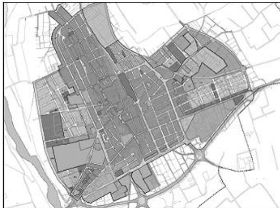
Plànol de Castelló.

En definitiva, un Pla General, no és ni més ni menys, que el disseny del poble que vullguem en el futur, tenint en compte el present i les seues característiques. Futur que pot ser més pròxim (10 anys, com a mínim) o més llunyà, tot va a dependre de la velocitat a la que es desenvolupa el seu creixement, si és que creix, per què tampoc és obligat i sincerament he de dir que esperem que es mantinga com està molt de temps. Es a dir, el fet de