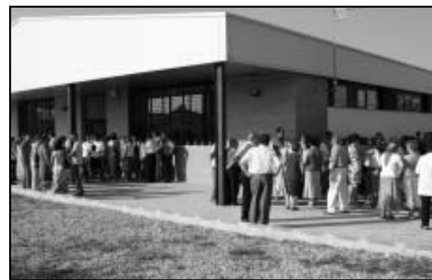
Instal·lacions del Centre Ocupacional. / R.V.