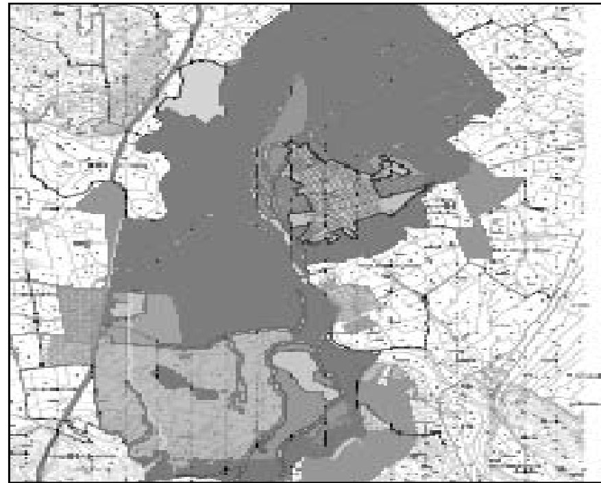
Plànols en els que podem veure el nostre poble i els seus voltants des de diferents vistes.

Este sistema ha sigut utilitzat per molts pobles, però amb una gran diferència respecte de nosaltres, han penjat els documents una vegada havia finalitzat el termini d'al·legacions. Nosaltres hem intentat millorar-lo, en el sentit que vulguem facilitar més les coses i donar més possibilitats al dret d'al·legar, tenint en compte que quan es puga accedir a la pàgina (espere que quèstió de dies des de hui), serà quan quedarà un més per a finalitzar el termini d'al·legacions.