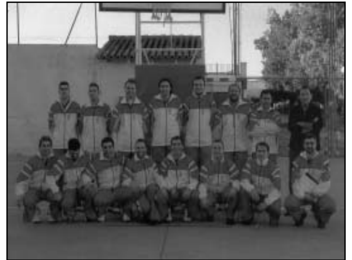
Membres de l'equip de bàsquet "Brots Bords".

Un any més, el "Club Bàsquet Castelló Brots Bords" ha estat present en les activitats de la setmana de festes.