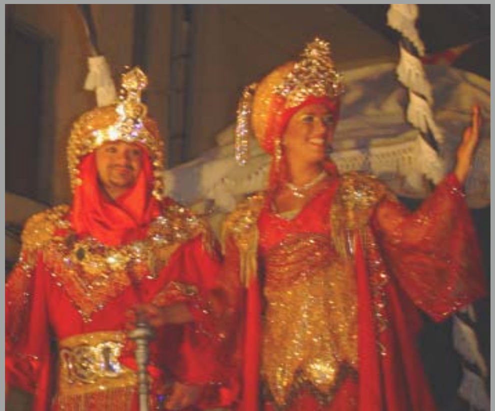
Les filades de moros i cristians tornaren a omplir Castelló de llum i color (capitania i sultania 2006). La tradicional processó dels melons tingué molts participants. /R.V.