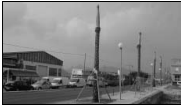
Palmeres per a l'entrada del municipi.

S'aprova per unanimitat l'adquisició de 15 palmeres datileres (phoenix datilifera) de 4 m de tronc, per plantar a l'entrada al municipi per la CV-560, a Jardines de Levante SL, per import total de 10.332,90 €