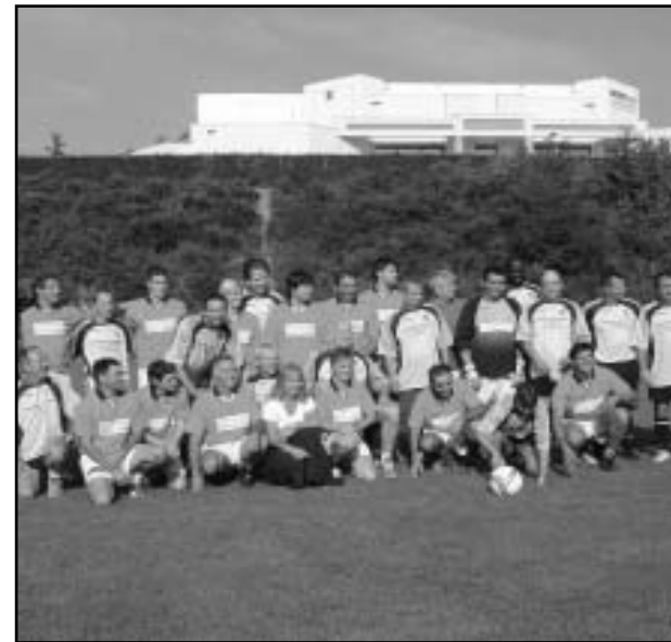
Membres dels equips de futbol que han participat en l'agermanament d'enguany.

gams d'agermanament i millorar els nostres coneixements dels costums i cultura francesos. Així, dissabte 9 es va realitzar una excursió per a visitar la regió de les Dombes, situada molt a prop de la ciutat de Lyó, que representa una zona lacustre de les més importants d'Europa, d'alta importància ecològica, ja que és una zona de descans de les aus migratòries en el seu camí des del Nord d'Europa cap al Sud d'Europa i l'Àfrica. Geogràficament, la zona de les Dombes està situada a l'Est de Lyó, de camí entre aquesta ciutat i Ginebra, i està constituïda per quasi 1000 estanys, que s'utilitzen per a l'explotació piscícola, base de l'economia d'aquella regió. Després de l'excursió ecologista, realitzarem una visita cultural a la ciutat medieval de Pérouges, ciutat situada en plena zona de les Dombes, i que conserva la seua estructura medieval, amb les seues muralles, torres de defensa, carrers empedrats, palaus medievals, etc.