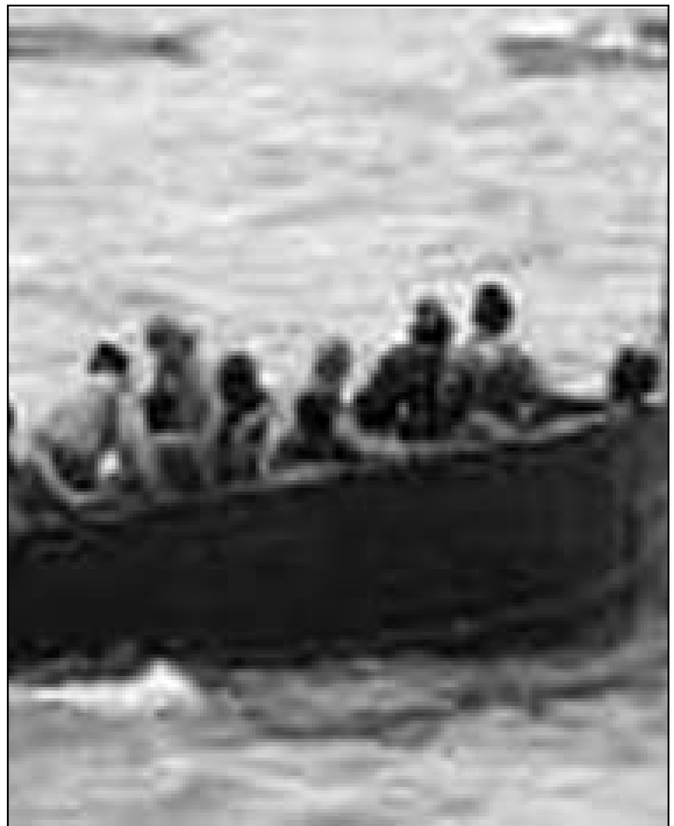
Les pateres no deixen d'aplegar a les costes.

Abandonar les estratègies migratòries que cal establir a les autoritats de l'Estat receptor és una actitud profundament hipòcrita. Hi ha prou al llençar les -quasi segures- causes d'aquesta riuada de cayucos. Després d'anys d'explotació colonial, Senegal aconseguí la independència de França el 1960.