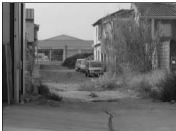
Carrer Salvador Pons.

I. Dotar del suficient i adequat crèdit pressupostari a la partida "4321.69203" del Pressupost de despeses de l'exercici 2006 per import de 6.967,68 € i finançar dit suplement de crèdit amb l'ampliació del concepte "39601" del Pressupost d'Ingressos del mateix exercici 2006, per la mateixa quantia.