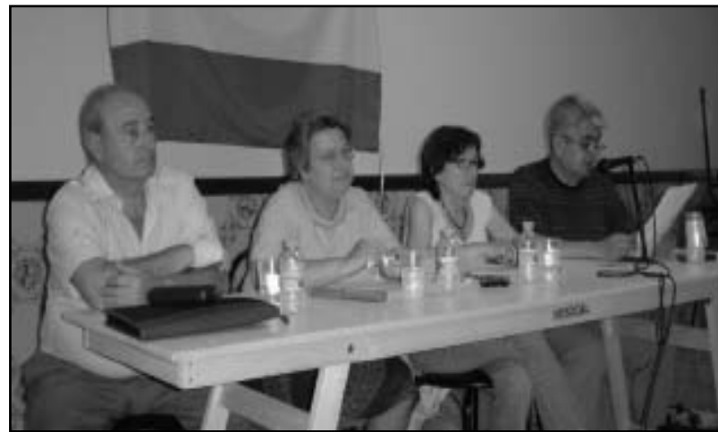
Imatges de la xerrada-col·loqui realitzada al bar de la Societat Musical.

El tema fonamental va ser el problema de les fosses comuns del cementeri de València, el primer que feren els membres de l'associació va ser buscar on estaven els morts haguts després d'acabada la guerra. Al cementeri de València trobaren un llibre de registre d'enterraments i esbrinant han descobert que en aquest cementeri hi ha més de 28.000 m2 de fosses comuns en les que es van