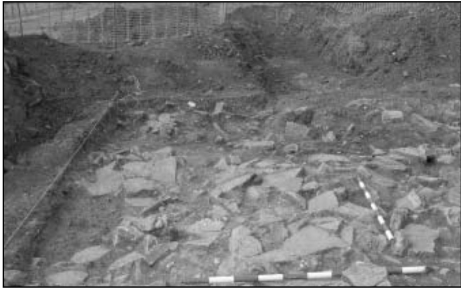
Jaciment arqueològic als terrenys del futur parc empresarial El Pla .

El jaciment arqueològic trobat per un veí del poble als terrenys de El Pla , degué pertanyer a una Vila Romana