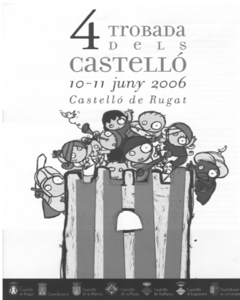
Cartell anunciador de la Trobada celebrada a Castelló de Rugat.

A les 11,30 hores van començar els actes oficials a la plaça 9 d'Octubre, amb la recepció dels Castelló participants i un passacarrer amenitzat per la colla de tabaletes i dolçainers de Castelló de la Plana i de Castelló de Rugat en el que es va recórrer el carrers cèntrics de la pobla-