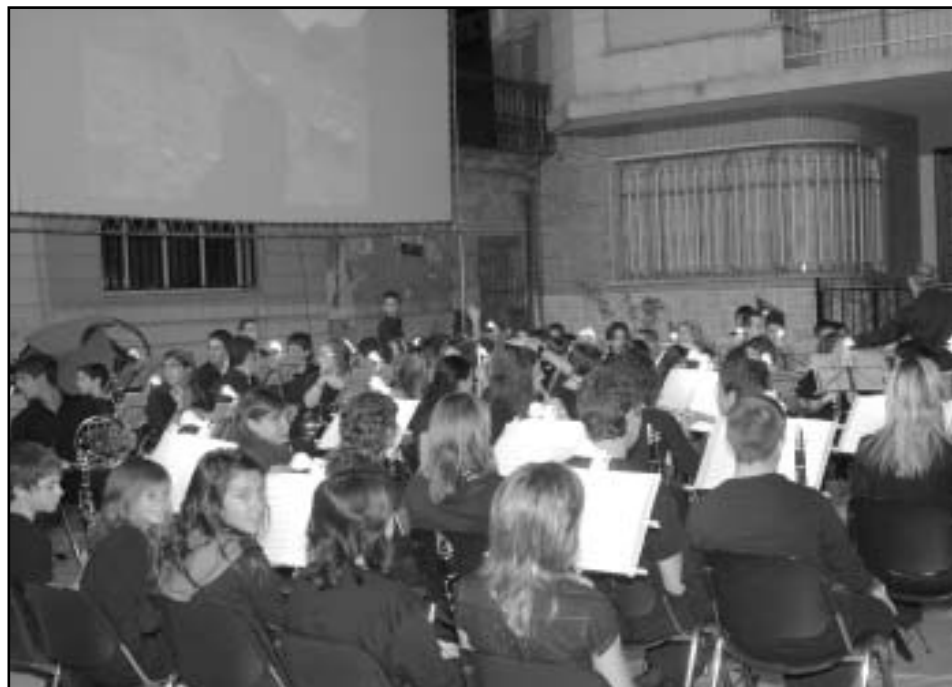
Concert a la fresca celebrat el passat 16 de setembre a la Plaça de l'Om.

Un concert valuós, amb el valor afegit pel repte, pel resultat, i sobre tot per implicar un treball col·laboratiu que naix en l'Escola de Música, (que té oberta la matrícula a grans i menuts) i perdura en la Banda Juvenil amb concerts tant valuosos com el Concert a la Fresca, que amb el patrocini de l'Ajuntament organitzà la Societat Musical.