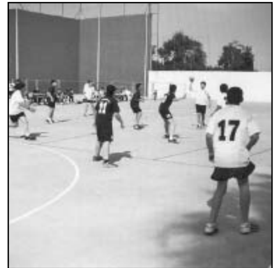
Equip d'handbol en un dels partits.