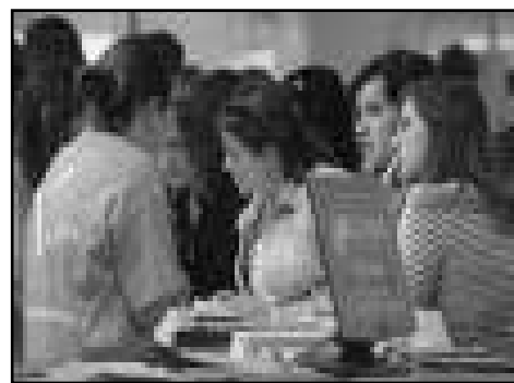
Imatges de la Fira de Formaempleo al recinte de la Fira de Mostres a València

Les empreses més innovadores i líders del mercat demanaven als seus tre-