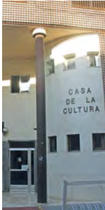
Casa de la Cultura. / REDACCIÓ

No vull parlar ara de les mancances de la nostra biblioteca, que en són moltes i que la fan poc menys que inoperativa, com, per exemple, l'absència total d'un arxiu. No sols és que no dispose d'un arxiu informàtic,