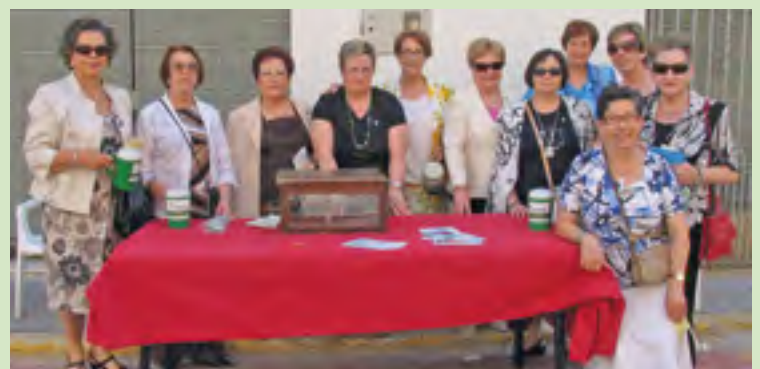
Les col.laboradores d'A.E.C.C el passat 23 de maig